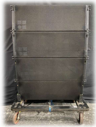
Imagem do Sistema Line Array