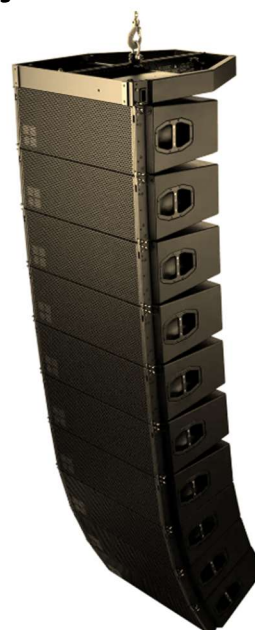
Imagem do Sistema Line Array instalado, pronto para uso